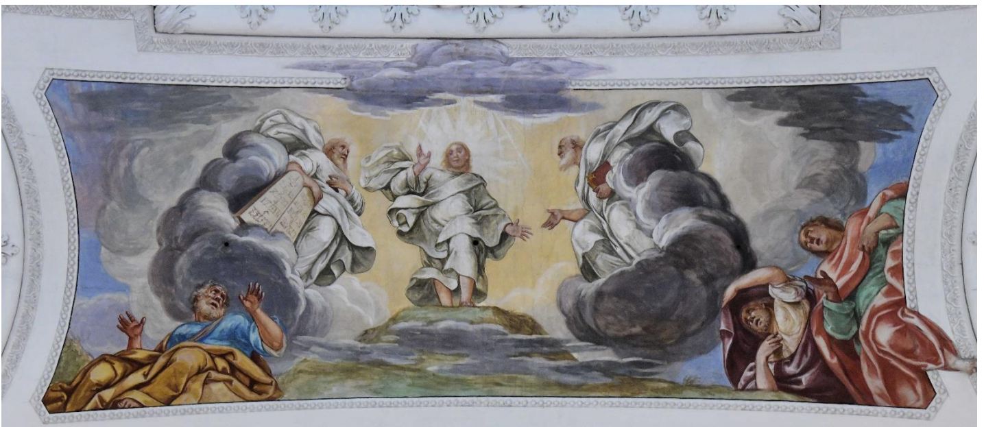
Verklärung, Deckengemälde Klosterkirche Benediktbeuren