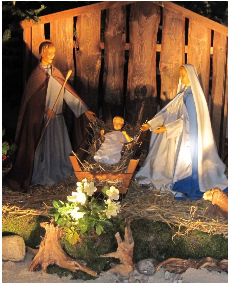
St. Marien Bad Lippspringe

WIR WÜNSCHEN ALLEN GEMEINDEMITGLIEDERN UND GÄSTEN EIN GESEGNETES WEIHNACHTSFEST UND EIN FROHES NEUES JAHR 2020!