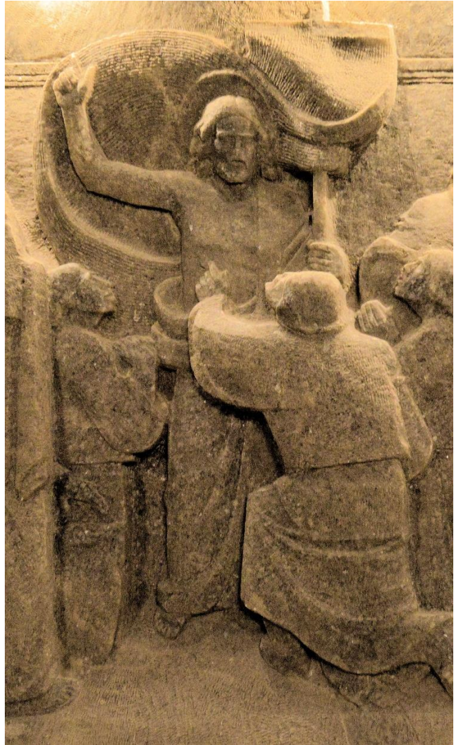
Salzbergwerk Wieliczka Krakau

Beide Hoffnungen wünsche ich Ihnen in dieser Osterzeit! Ihr Burkhard Neumann