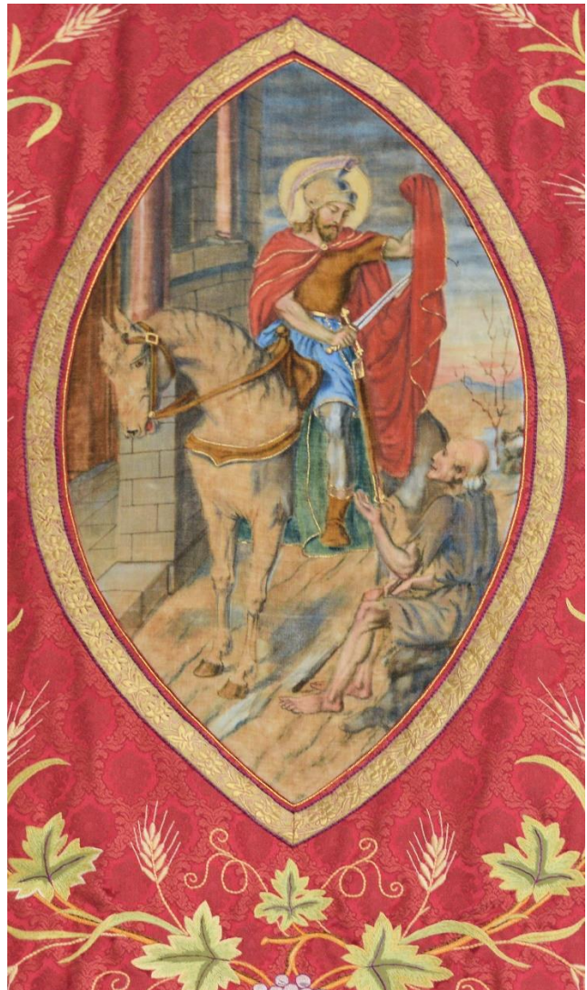
Fahne St. Martin, Garmisch