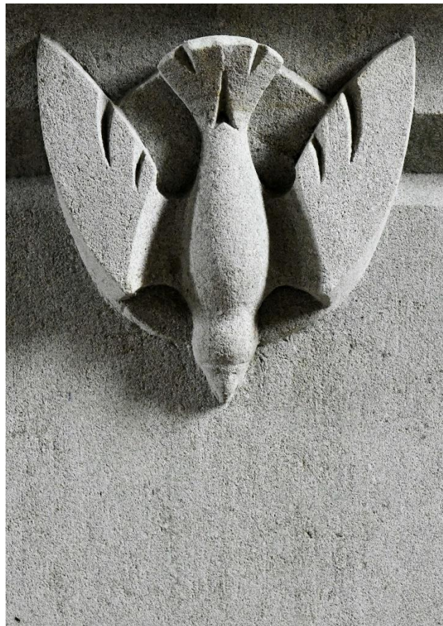
Ambo St. Alexius Benhausen